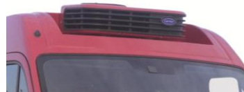
Gruppe eingelassen + Option mit Anstrich