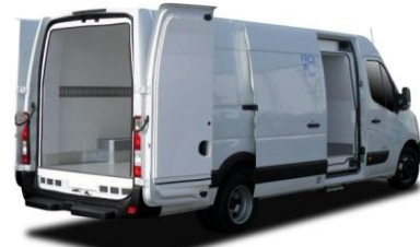
Version Heckantrieb L4