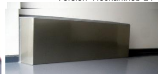
Radkästen mit INOX-Schlagschutz